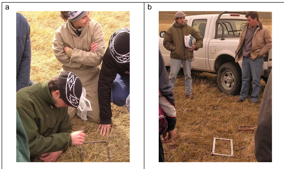
Figura 3. a) Cortes de disponibilidad en marcos en la estepa, y b) cortes de estimación de Botanal en las vegas.