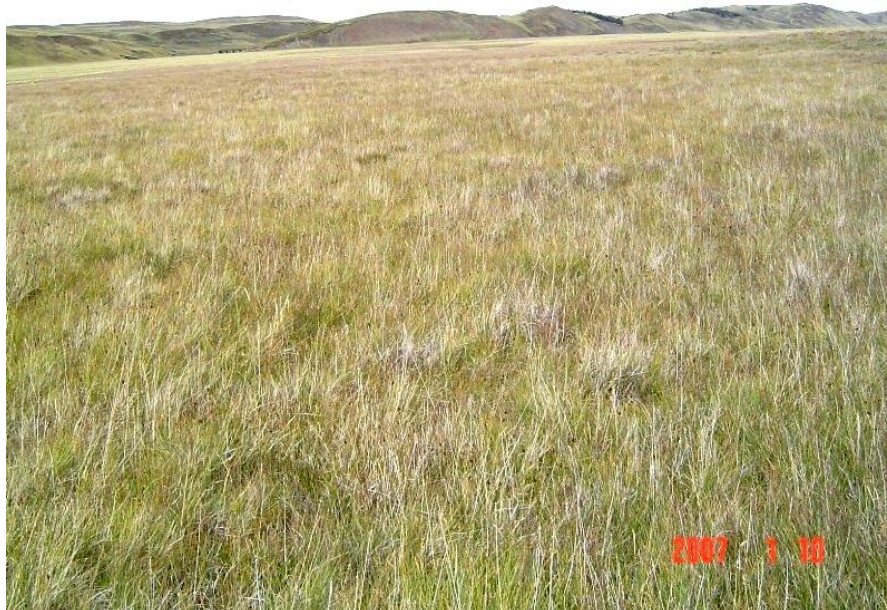
Figura 7. Vista de una vega húmeda de gramínoideas en el Ecotono de Tierra del Fuego.

Equipo necesario: Alambrado tradicional con alambre de alta resistencia y de púas (para vacunos), postes y varillas de madera, torniquetes y alambre para atar. Alambrado eléctrico con alambre de mediana resistencia, postes y varillas de madera dura, torniquetes, aisladores, electrificador y voltímetro, batería y pantalla solar. Maquinaria de corte: Tractor, cortadora, acondicionadora e hileradora de arrastre y enrolladora o enfardadora.