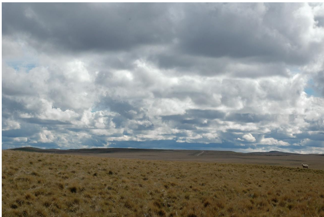
Figura 2. El método de evaluación de pastizales permite calcular la oferta forrajera de pastizales de coirón fueguino, como este ejemplo de Estancia San Julio, Tierra del Fuego.

Para la planificación del pastoreo se considera a la disponibilidad total del estrato intercoironal como forraje consumible. La receptividad (número de animales que pueden pastorear una determinada superficie sin degradar el recurso) se calcula asignando forraje consumible para cubrir los requerimientos anuales de cada categoría de ovino. Generalmente este sistema se aplica en sistemas de pastoreo continuo o estacional, aunque puede utilizarse para calcular raciones en un sistema de tipo rotativo. La evaluación y planificación están concebidas como procesos anuales que van ajustando la carga en un esquema adaptativo.