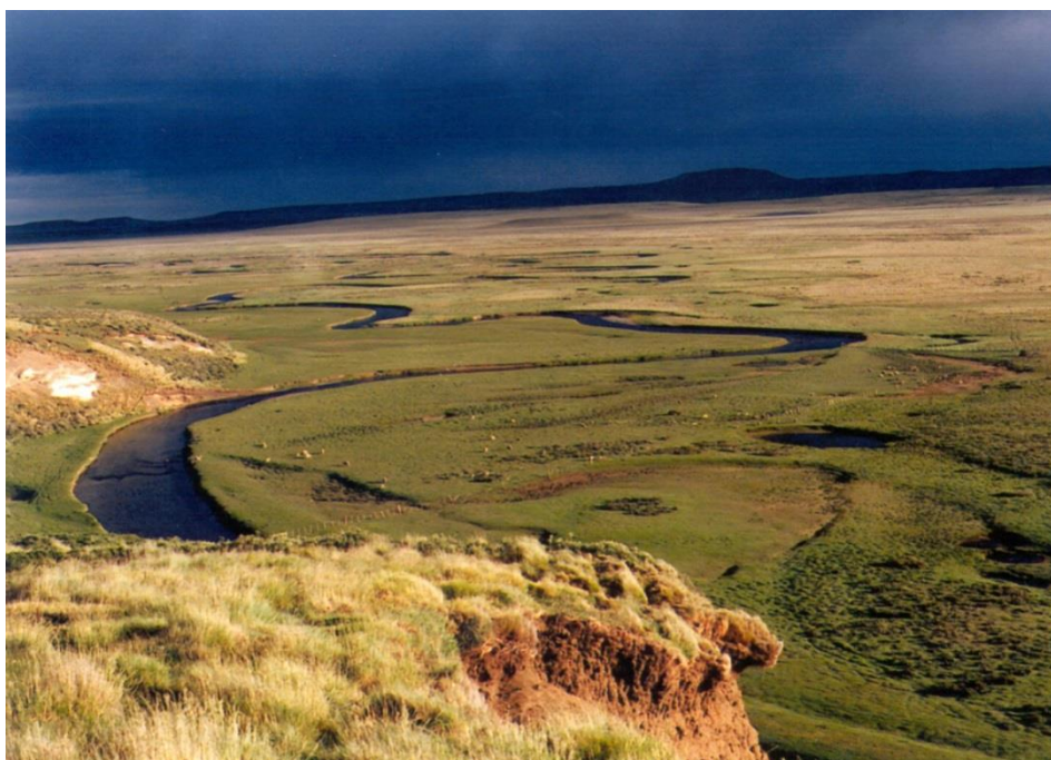
Figura 6. Vista general de mallines húmedos. Tierra del Fuego.

degradación de los mallines. En este caso, se requiere establecer el tiempo de permanencia del ganado en cada potrero. Más detalles en Utrilla et al. (2005).