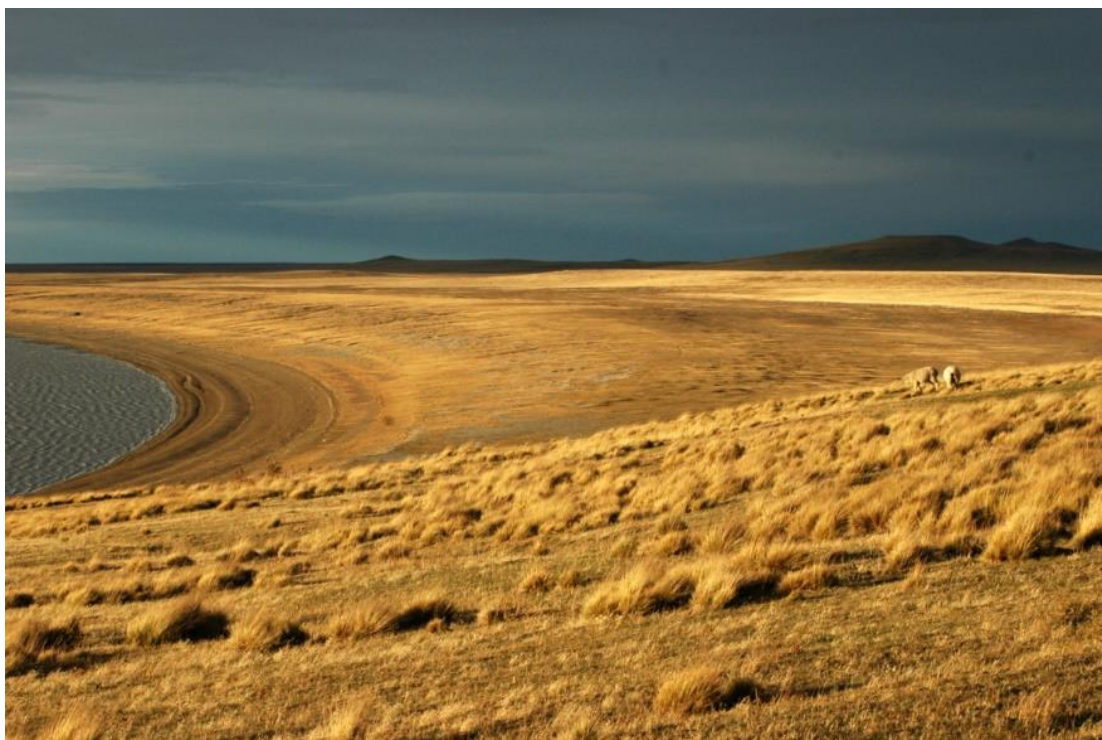
Figura 5. Área de acumulación de arena asociada a una laguna temporaria en Ea. San Julio. Tierra del Fuego.

Normas técnicas: La siembra se realiza en secano. Previamente se realiza un escarificado mediante surcadores en líneas perpendiculares a la dirección del viento con una separación variable de 1,5 a 6 m, acorde a las características topográficas del terreno y a la rapidez con la que se pretende estabilizar el médano. Si es posible las tareas de escarificado se hacen una temporada antes de la siembra, para que se acumulen sedimentos, semillas y agua en el fondo del surco. La siembra se realiza en estas franjas con arado de cincel, con cajón de siembra. La semilla se deposita en el fondo del surco, a una profundidad de 5 cm. La densidad de siembra oscila entre 3 kg ha -1 para Elymus sabulosus y 5 kg ha -1 para Elymus arenarius . Lo recomendable es realizar la siembra entre los meses de marzo y mayo, en el otoño, en esta estación las condiciones de humedad del suelo suelen ser más apropiadas y la velocidad del viento menor. La semilla se obtiene de cosecha manual a partir de poblaciones naturalizadas. Santa Cruz y Chubut tienen importantes semilleros.