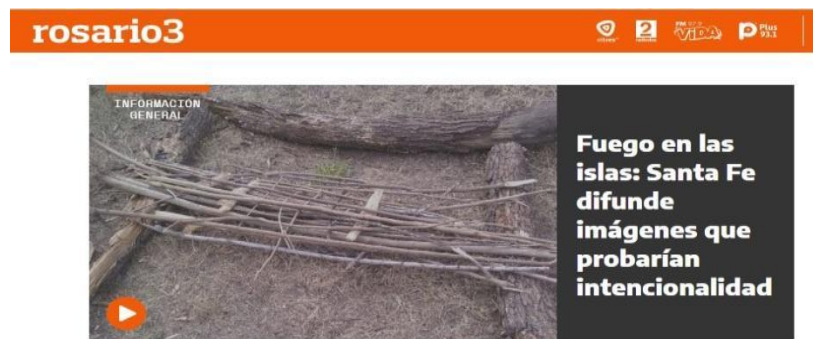
Figura N° 4

Objetivo Esp. N° 1.- Inventario de Tratados, Leyes, Decretos, Ordenanzas, Normas y Reglamentaciones Nacionales, Provinciales y Municipales; y Fallos Judiciales.