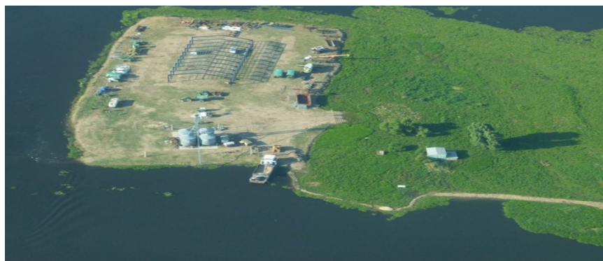
Cuadro N° 1