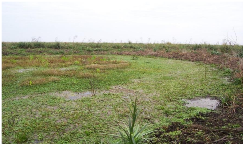
Figura N° 1

Pozos Indios, encontrados en Isla San Felipe en Victoria (Sitio experimental de la AER INTA Victoria) preservados como Sitos Arqueológicos, probablemente pertenecientes a las comunidades indígenas Chaná-Timbúes