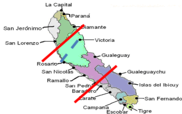
Figura 1: Área de estudio

En el Delta Entrerriano podemos apreciar 3 áreas más homogéneas, a grandes rasgos; la primera arriba de la línea roja el denominado “Pre-Delta”, entre las 2 líneas rojas el “Delta Medio” y debajo de la última línea roja el “Bajo Delta”. La línea azul representa la unión vial Victoria – Rosario.